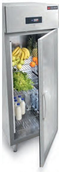
Porta a vetro