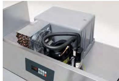
Unità condensatrice monoblocco