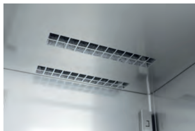
Dettagli della ventilazione interna