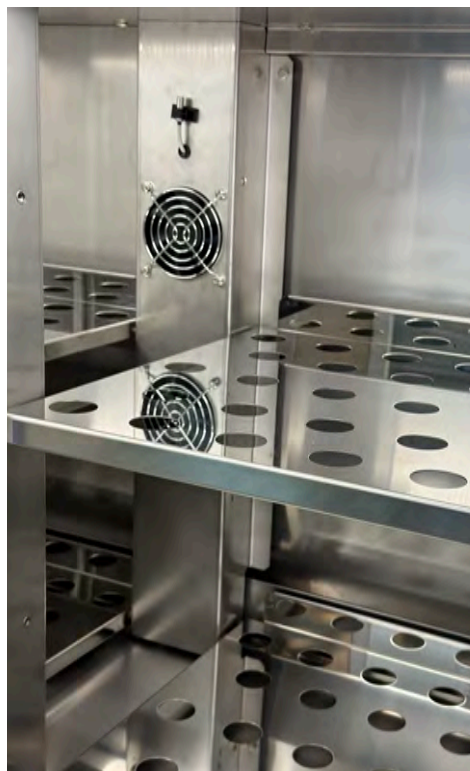
Particolare ripiano forato