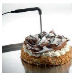
Sonda al cuore

*Temperatura ambiente +32°C – campioni prodotto gr. 125 norme DIN 8953/8954 **Evap. -10°C cond. +45°C ***ASHRAE (Evap. -23,3°C cond. +54,4°C)