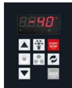
Pannello do controllo