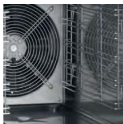
Dettagli ventilazione interna