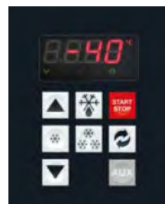
Tableau de contrôle