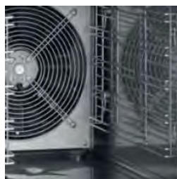
Détails de la ventilation interne