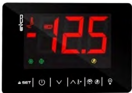
Scheda elettronica touch