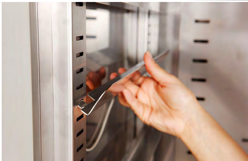
Cremagliera inox 74 posizioni