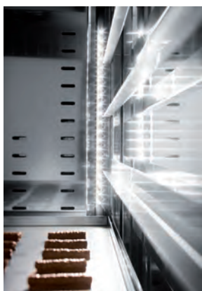
Particolare interno cella