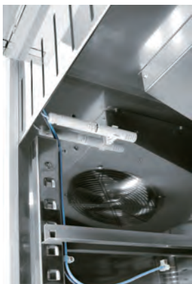
Sonda elettronica controllo umidità