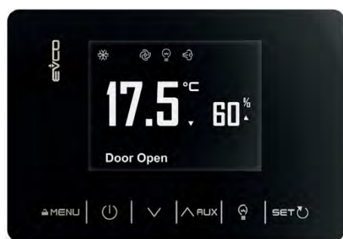
Scheda elettronica touch