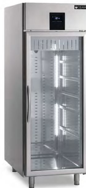
Versione porta a vetro e illuminazione led