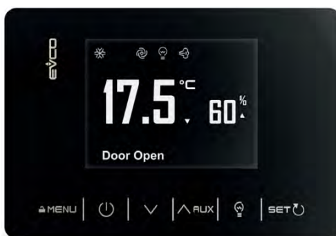
Scheda elettronica touch