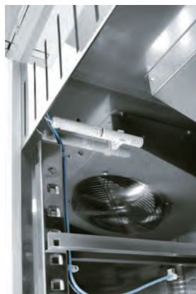
Sonda elettronica controllo umidità