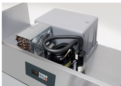
Groupe frigorifique monobloc