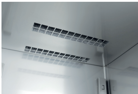
Détail ventilation intérieure