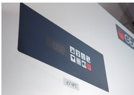
Contrôle digitale de retro-panneau