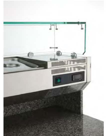
Détails de la vitrine portebacs (bacs GN non inclus)