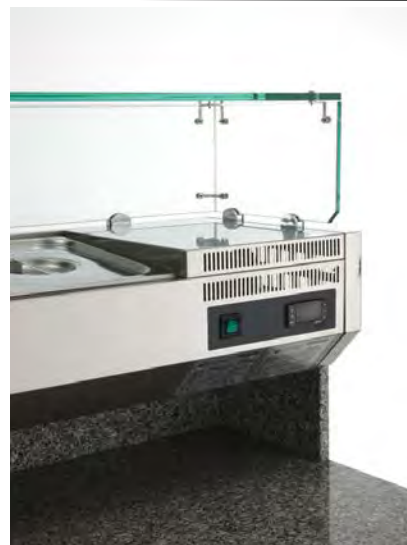
Dettagli vetrinetta portaingredienti (bacinelle GN escluse)